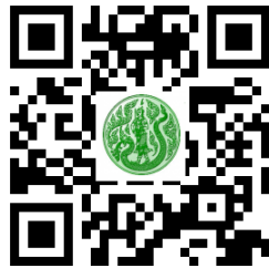
รายงานการประชุมฯ ครั้งที่ ๑/๒๕๖๔

๙. กระทรวงเกษตรและสหกรณ์ มีคำสั่งที่ พิเศษ/๒๕๖๔ ลงวันที่ ๑ กันยายน ๒๕๖๔ เรื่อง แต่งตั้งคณะทำงานที่ปรึกษารัฐมนตรีว่าการกระทรวงเกษตรและสหกรณ์เพื่อขับเคลื่อนโครงการตลาดกลางสินค้าเกษตรเพชรบุรีโมเดล (แก้ไขเพิ่มเติม) โดยมีการเพิ่มองค์ประกอบคณะทำงาน ๘ ราย และแก้ไขชื่อ – นามสกุล – ตำแหน่ง จำนวน ๓ ราย และจัดประชุมคณะทำงานฯ ครั้งที่ ๒/๒๕๖๔ เมื่อวันที่ ๖ กันยายน ๒๕๖๔ เวลา ๑๓.๓๐ – ๑๗.๐๐ น. ณ ห้องประชุมสำนักงานเกษตรและสหกรณ์จังหวัดเพชรบุรี และผ่านระบบ Zoom โดยสาระสำคัญของการประชุม คือ การเห็นชอบแผนการขับเคลื่อนงานตลาดกลางสินค้าเกษตรเพชรบุรีโมเดล ดังนี้